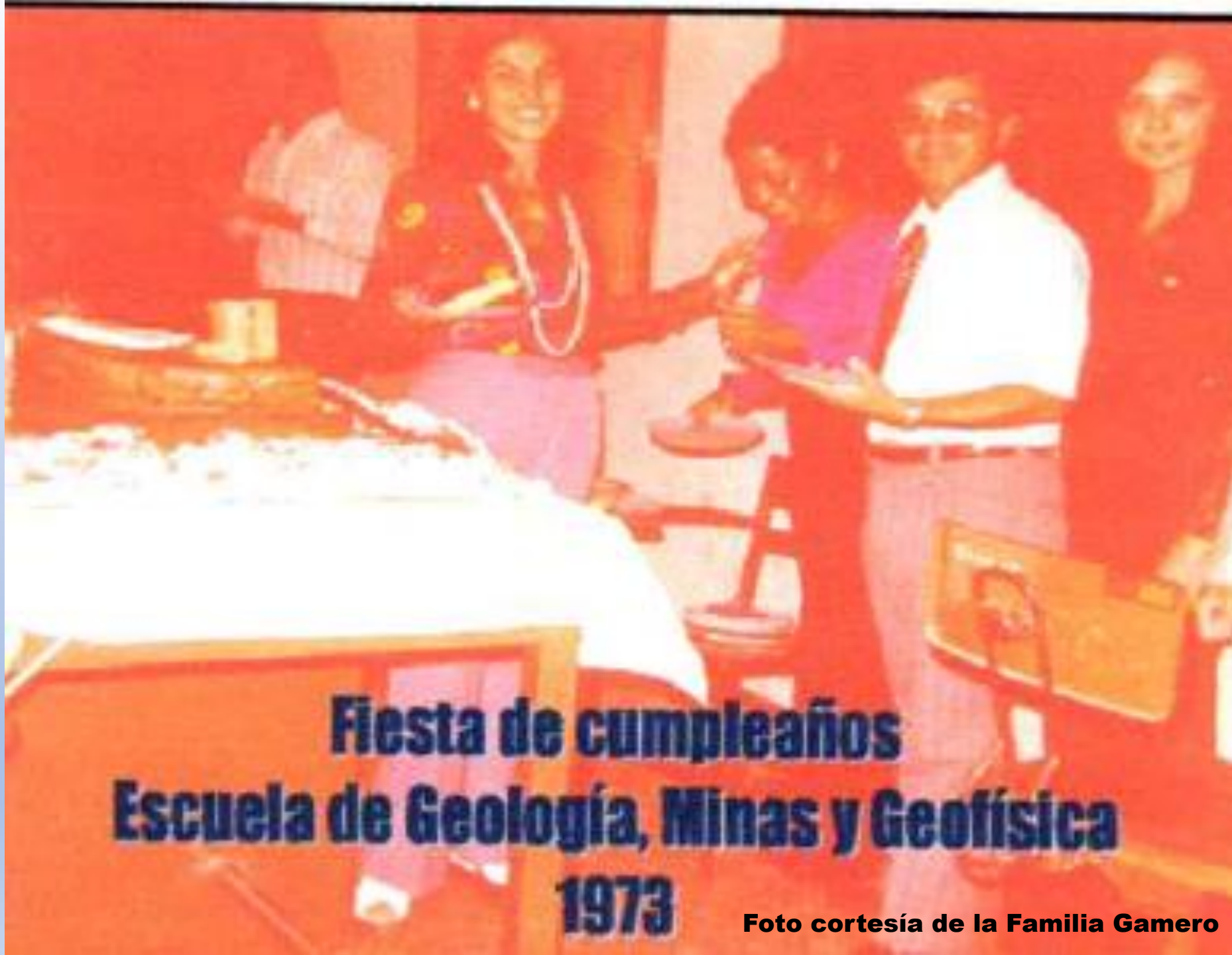
Fiesta de cumpleaños Escuela de Geología, Minas y Geofísica 1973