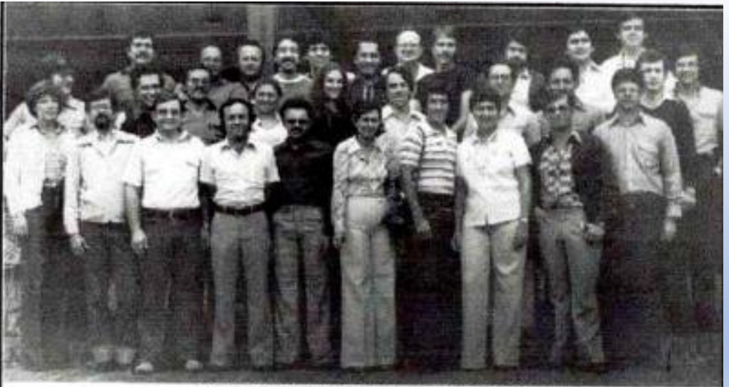
FACIES CLASTICAS 1979 - HOTEL TAMA SAN CRISTOBAL