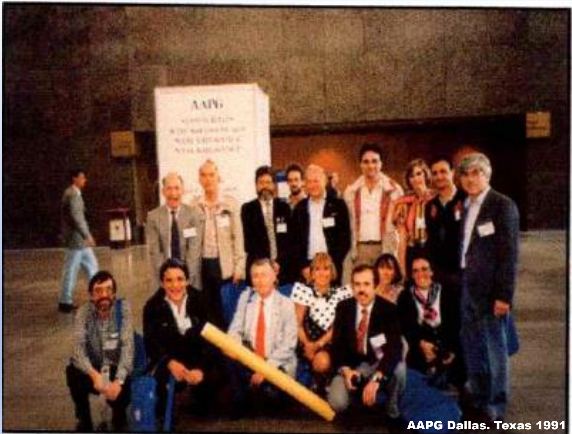
AAPG Dallas. Texas 1991