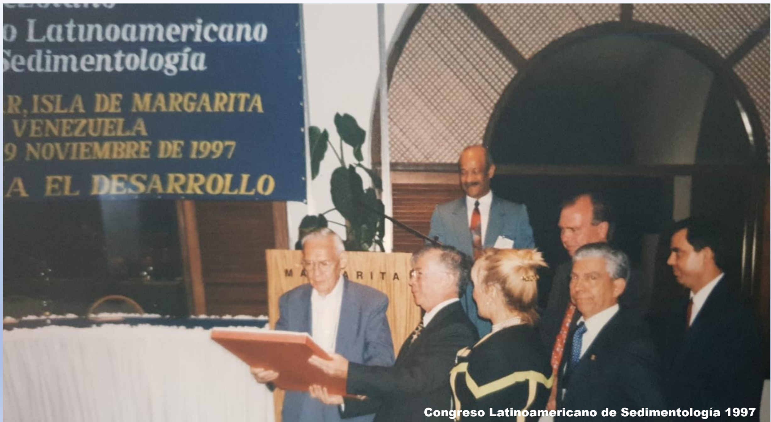
Congreso Latinoamericano de Sedimentología 1997