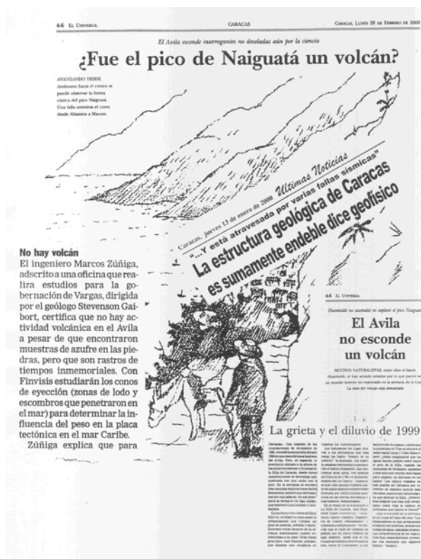
Fig. 3. ¿Amenazas en “collage”?

Vargas.- En toda la región se corrió el rumor de que el estado sería devastado completamente por un nuevo desastre (...). (...) el pánico se apoderó la tarde de ayer de los habitantes del estado Vargas, ante un fuerte rumor según el cual una tormenta se estaba formando en las costas del Caribe y el Litoral Central sería una de las zonas más afectadas. Igualmente se dijo que en el Ávila un enorme dique estaría por romperse, trayendo consecuencias catastróficas. La mayoría de los negocios bajaron las santamarías y las empresas dejaron ir a sus casas a los empleados, quienes estaban aterrados por el rumor sobre que el estado Vargas iba a desaparecer. 7