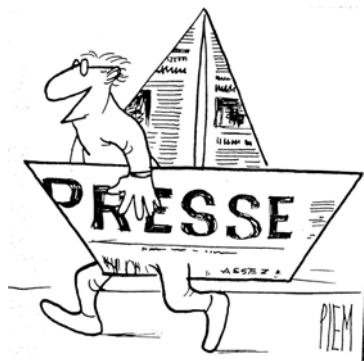
Fig. 1. ... A la recherche d'un bon titre « à la une ». Tomado de S.E.R.M. (1986)

fenómeno, además del medio físico en el cual se ha producido. Ello redundando en afirmaciones simplistas o en la búsqueda de un buen titular (Fig. 1), hecho muy alejado de una información eficaz en el caso de desastres.