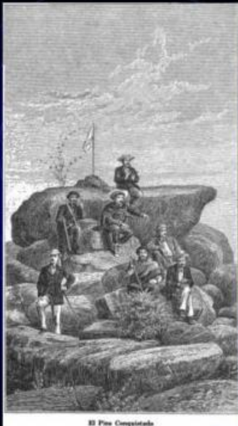
El Pico Conquistado

• James Mudie Spence (1872, 8 de abril): (...) por todo el camino no hicimos sino oír que la fogata y los cohetes lanzados desde La Silla habían causado gran sensación (...)