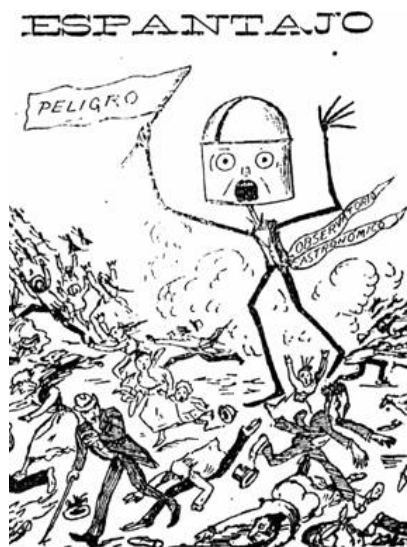
Fig. 6. El Observatorio anunciando el volcán. La Linterna Mágica (1900)

De repente circuló una extraña noticia. En el Observatorio Astronómico flameaba una bandera negra. Y corrió junto con un escalofrío de pavora, el anónimo y absurdo anuncio que a las doce estallaría un volcán en el monte Ávila. 26