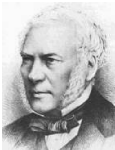
Fig. 5. J. B. Boussingault

El botánico alemán Karl Moritz durante su descenso de la Silla en 1843 observa (TRUJILLO, 1971):