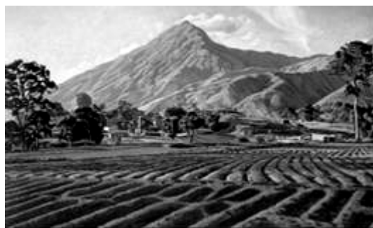
Fig. 2. "Verano" (1945-1955). Manuel CABRÉ

... ¿Y entonces para qué Manuel Cabré (Fig. 2)?