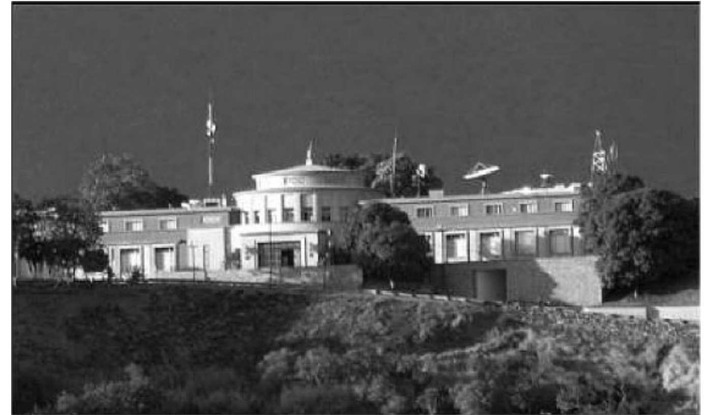
Fachada frontal del Observatorio Cagigal, ubicada el Loma Quintana o Colina del Observatorio.

Röhl, E. (1990). Historia de las ciencias geográficas en Venezuela . Fundación Banco Unión, 514 pp.