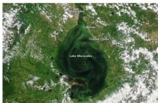
Figura 1 Lago de Maracaibo y su entorno. Imagen del 25 de septiembre, 2021

En imágenes satelitales adquiridas en septiembre de 2021, el Lago Maracaibo se observa arremolinado con tonos de verde, bronceado y gris que trazan el flujo de corrientes y remolinos (Fig. 1). Los colores se deben a las algas, los sedimentos de los ríos y las fugas de petróleo (Fig. 2).