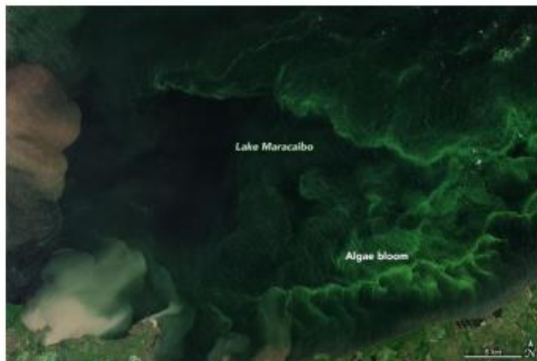
Figura 3. Imagen del 2 de Septiembre, 2021, adquirida por MultiSpectral Imager en Sentinel-2 de la Agencia Espacial Europea.

El verdor generalizado en el agua es otro signo de angustia. La Fig. 3 del 2 de septiembre de 2021, es una imagen en color natural y muestra la extensión de las algas en el extremo sur del Lago de Maracaibo.