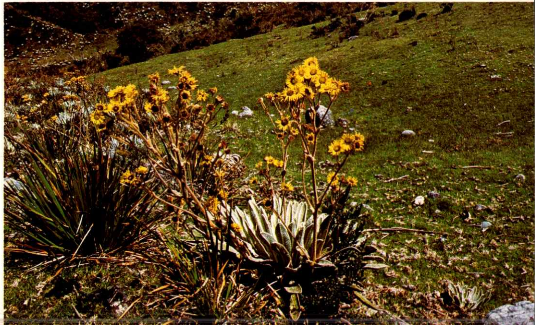
Frallejón, planta característica del lugar.

Sierra Nevada constituye un importante refugio para algunas especies singulares y en peligro de extinción como son el oso frontino de anteojos y el gran cóndor de los Andes, ambas muy importantes desde el punto de vista biológico.