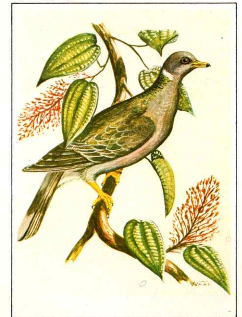
Paloma gargantilla ( Columba fasciata )

La presencia de los variados ecosistemas aquí descritos, catalogan, sin lugar a dudas, a Sierra Nevada como un parque nacional integral. Sus aguas, suelos, flora, fauna, paisaje, clima y áreas histórico-culturales, lo convierten en objetivo de preservación para el sano disfrute de todos los amantes de la naturaleza.