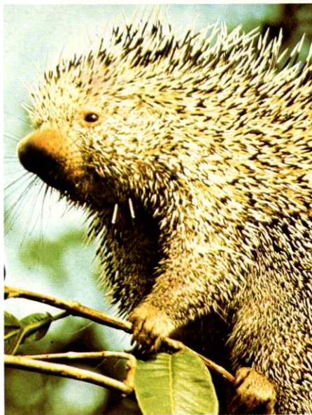
Puerco espin ( Coendu pruinosis )

Debido a la variedad de sus altitudes, el Parque Nacional Sierra Nevada es el único en Venezuela que incluye toda una serie de sucesiones vegetales que abarcan desde las selvas pluviales de las faldas de las montañas, hasta los páramos y nieves perpétuas en las cumbres de la serranía.