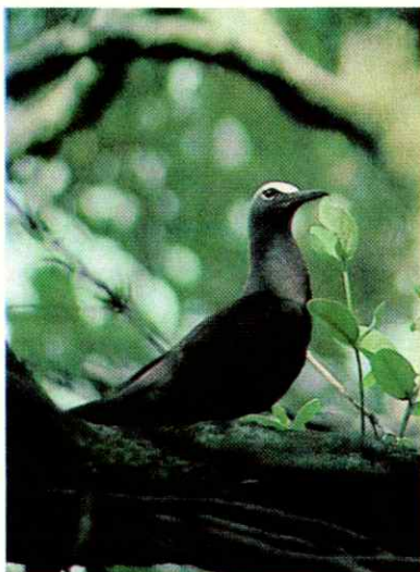
La gaviota Tiñosa ( Anous stolidus ) es el segundo grupo más numeroso de aves que arriba a la isla.

Situada en pleno mar Caribe, a 648 Km de La Guaira y a 540 Km aproximadamente de la isla de Margarita, un minúsculo islote de forma alargada y angosta en su parte central, representa el punto más septentrional de nuestro territorio nacional.