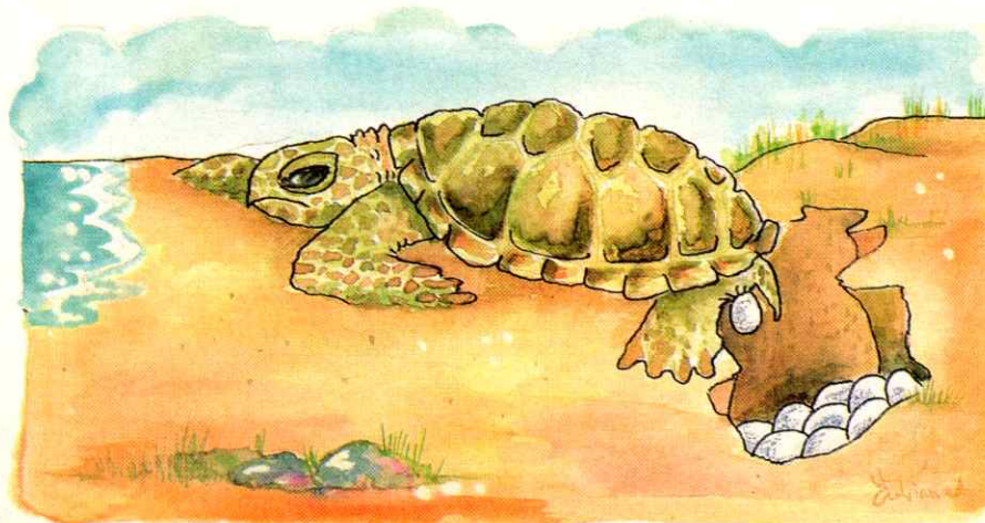
Una masa gelatinosa lubricante recubre los huevos para evitar el roce de las cáscaras.

El tamaño de las extremidades posteriores de las tortugas madres parece estar directamente relacionado con el tamaño de la camada. Se ha encontrado una correspondencia entre la talla de la tortuga y el número de huevos puestos. Así mismo, el tamaño característico de la nidada está correlacionado con la proporción entre la longitud de las extremidades posteriores y el diámetro del huevo.