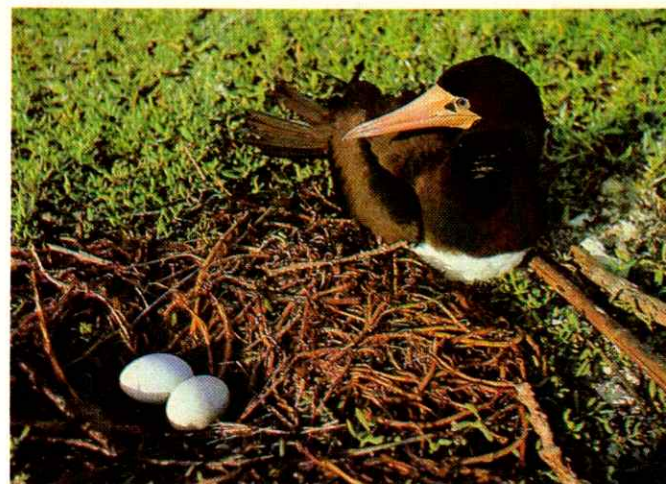
En isla Aves convergen más de 300 mil gaviotas adultas para el apareamiento.

El interés acerca del ciclo de vida de las tortugas marinas se ha incrementado en los últimos años, probablemente motivado por el exitoso comercio de algunas especies y porque además se encuentran, en mayor o menor grado, en peligro de extinción. Por ello el Ejecutivo Nacional, a través del Decreto No. 1069 del 23 de agosto de 1972, declaró a isla Aves "Refugio de Fauna Silvestre"