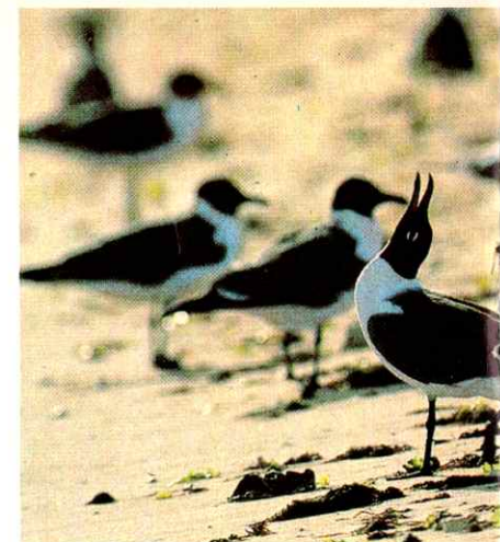
Gaviota Guanaguana ( Larus atricilla ).

Sobre este pequeño punto en el Caribe de apenas 4,1 hectáreas se reúnen durante cierta época del año más de 300.000 gaviotas para reproducirse y perpetuar su especie. Este extenso grupo migratorio integrado por la gaviota de Veras ( Sterna fuscata ) y la gaviota Tiñosa ( Anous stolidus ) representan la mayoría de las aves migratorias que junto a otras variadas especies como por ejemplo, el halcón peregrino ( Falco peregrinus anatum ) que utiliza la isla