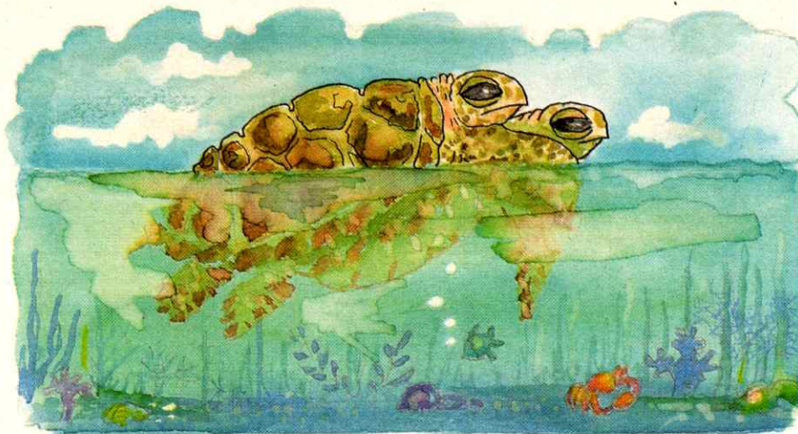
La tortuga verde ( Chelonia mydas ) sólo efectúa el desove durante la noche.

los depredadores. Para evitar esta situación los investigadores de Fudena han tomado la determinación de reubicar los nidos alejándolos de las áreas cercanas a la zona de mareas. Esta medida procuró, en 1986, la salvación de unos 2.500 huevos que se encontraban expuestos a ser descubiertos y atacados por los depredadores al retirarse las arenas adyacentes al nido por causa de los vientos y las mareas.