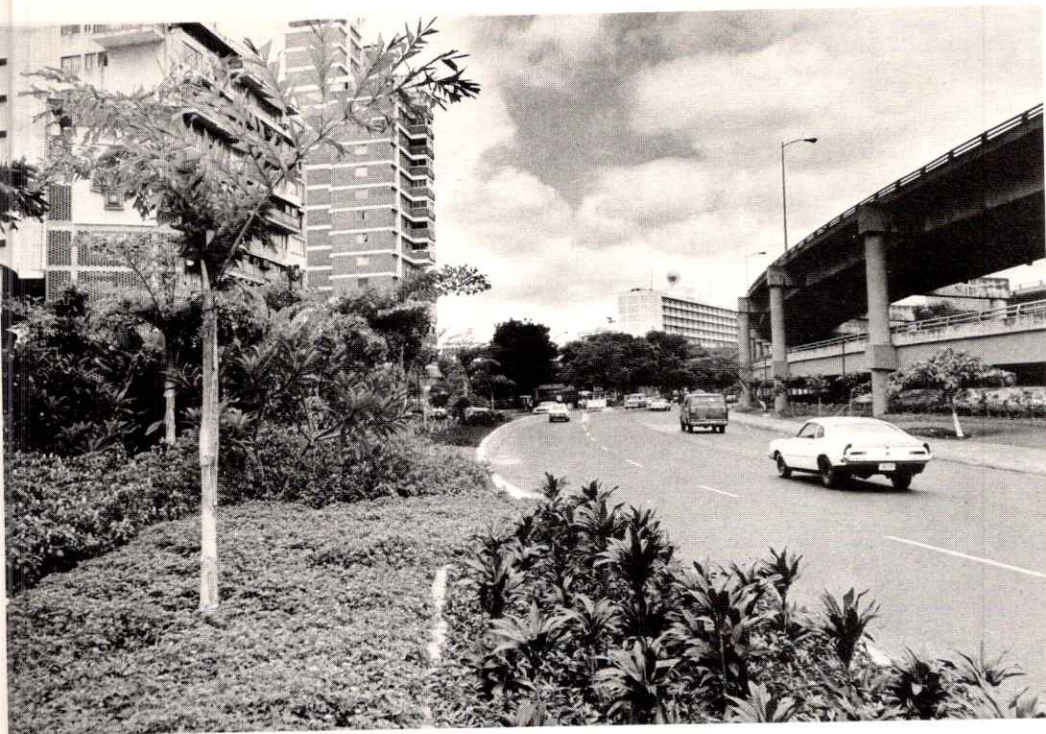
El proyecto nace de la preocupación de Lagoven por mejorar las riberas del río Valle, cercanas al edificio sede de la empresa, en Caracas.